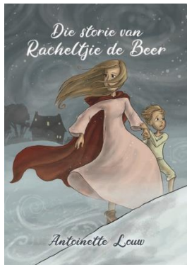
Die storie van Racheltjie de Beer

LITERATUURFEEES • LITERATURE FESTIVAL • DINGODILWENG