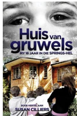
Huis van Gruwels: my 16 jaar in die Springs-hel