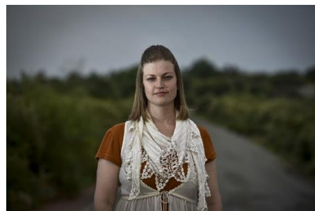
Madré Marais deur Mlungisi Louw 2020